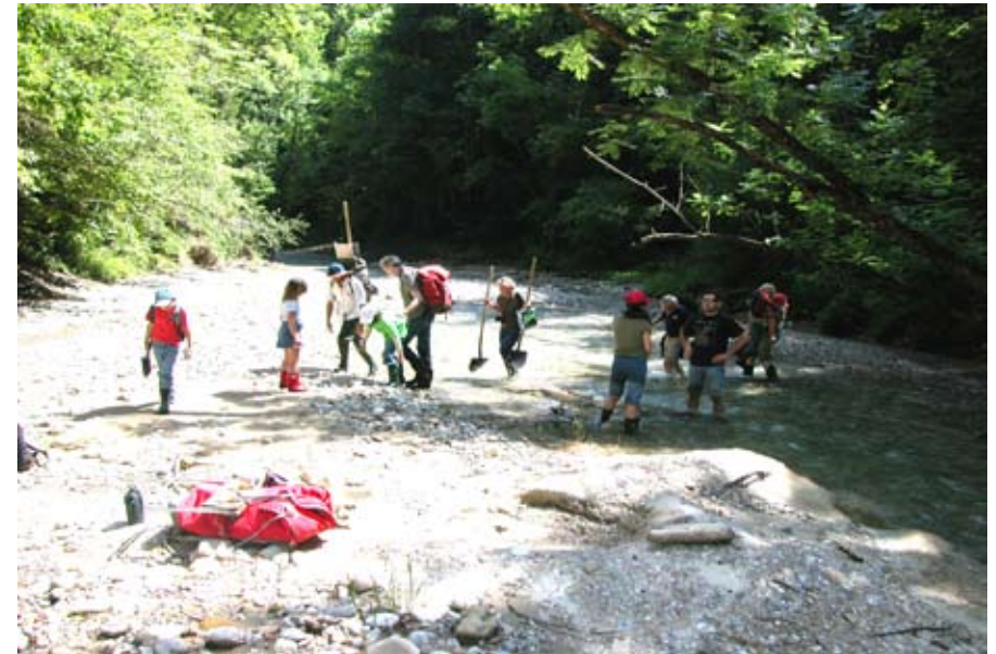
Goldwaschen im Napf. Eine spannende Exkursion im Jahr 2007

Wir sind nicht die Ersten die hier am Napf nach dem gelben Metall graben. Schon Posidonius (135-50 v. Chr.) und Strabo erwähnen die Seifengoldgewinnung in Helvetien. Ein Hinweis,