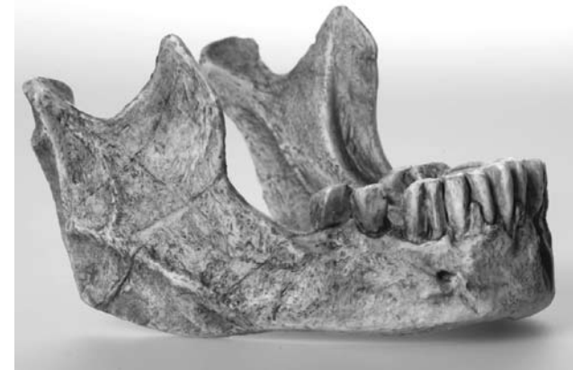
Durch die Freunde des Naturhistorischen Museums 2006 angekauft: Schädelabgüsse für die Ausstellung «Evolution der Säugetiere»