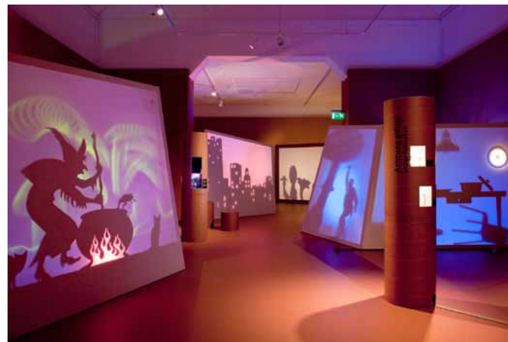
In der Pilzausstellung.