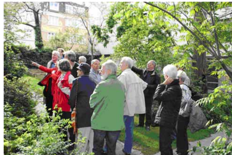
Das Grün stösst auf reges Interesse bei unseren Vereinsmitgliedern

Wie immer ist unser Ausflug in den Botanischen Garten auf grosses Interesse gestossen. Nicht das erste Mal sind wir zu Gast in dieser Institution. Die Anmeldungen für diesen Anlass waren so zahlreich, dass wir eine zweite Führungskraft organisieren mussten.