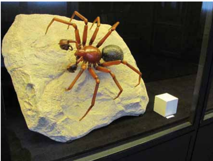
Walckenaeria acuminata Zwergspinne, das ausgestellte Model wurde von unserem Verein finanziert.

Walckenaeria acuminata BLACKWALL, 1833 (ohne deutschen Namen) Sie gehört zur Familie der Baldachinspinnen (Linyphiidae) und hier zu der Gruppe der Zwergspinnen (Micyrphantinae). Mit 3,0 bis 3,5 mm Grösse ist sie eine der grössten dieser «Zwerge». Die Art ist in Mitteleuropa recht häufig in Wäldern mittlerer Feuchte anzutreffen. Sie kommt sowohl im Flachland wie in den Bergzonen vor, nicht aber in den Alpen.